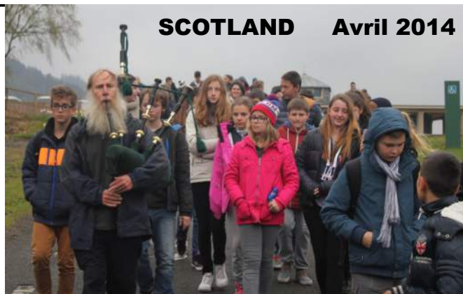
SCOTLAND Avril 2014