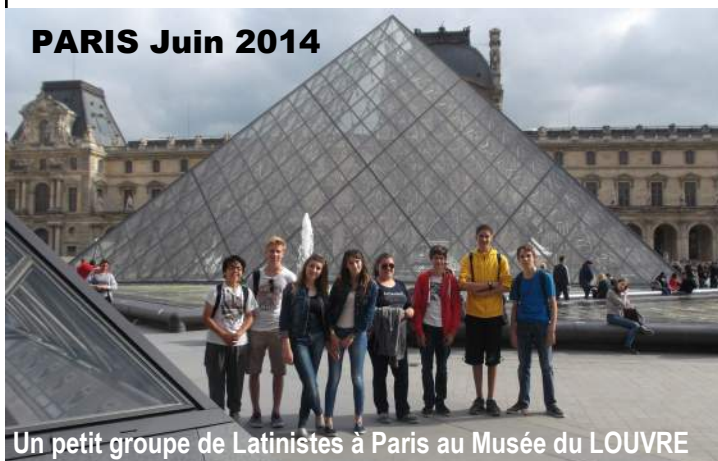
PARIS Juin 2014

Un petit groupe de Latinistes à Paris au Musée du LOUVRE