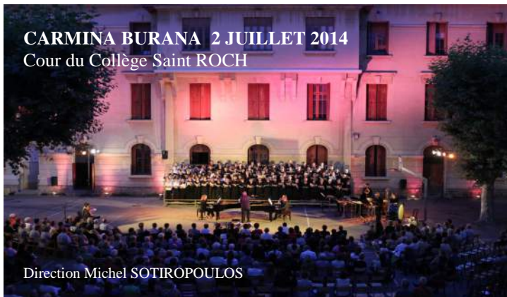
CARMINA BURANA 2 JUILLET 2014 Cour du Collège Saint ROCH