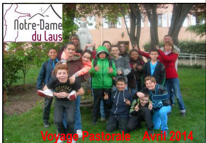
Voyage Pastorale Avril 2014

Un petit groupe de Latinistes à Paris au Musée du LOUVRE